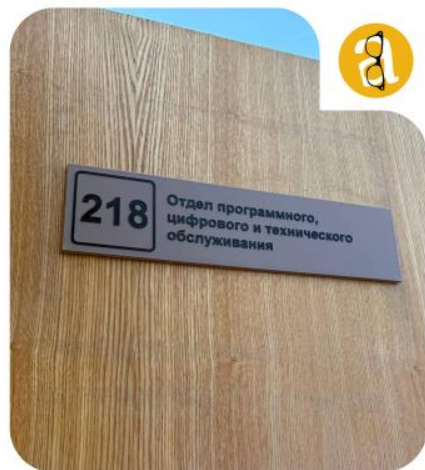
Таблички для кабинетов