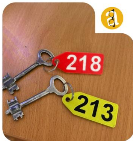
Брелки для ключей