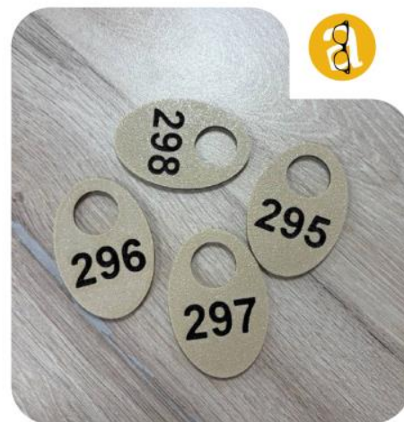
Бирки для гардероба