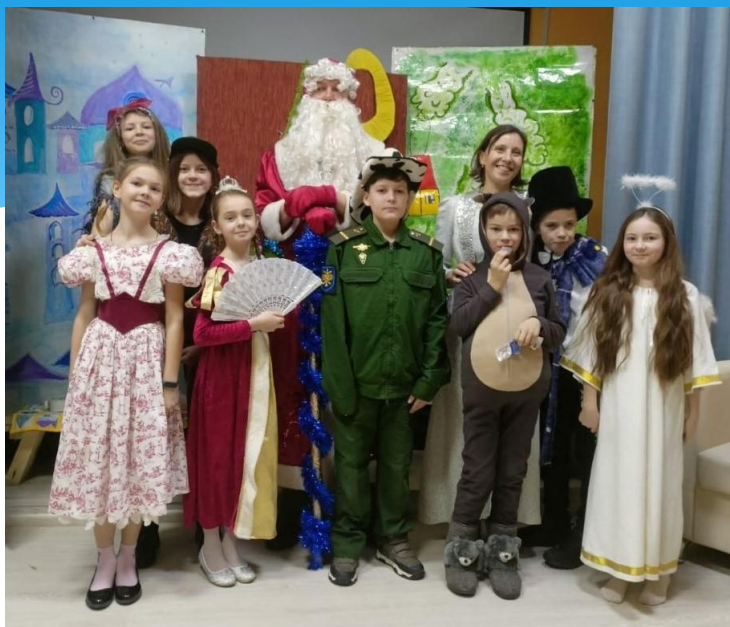
«Самый главный волшебник»