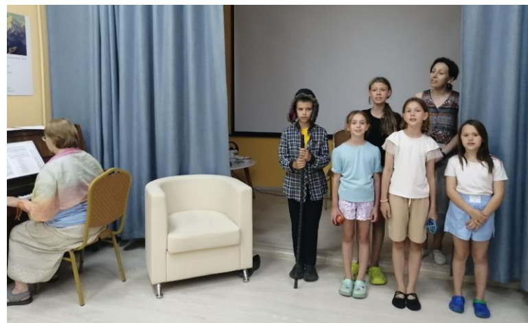
Зарисовки из жизни детей и родителей