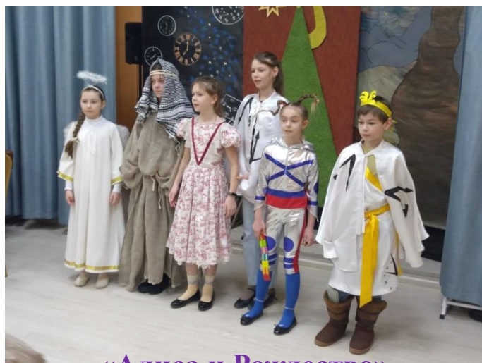
«Алиса и Рождество»