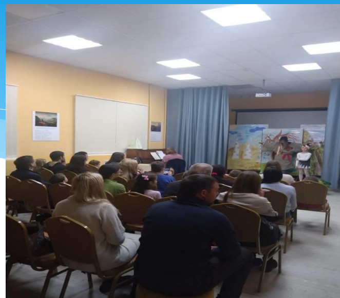
«Аистенок и пугало»